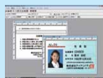
カードデザイン画面