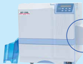
IC R/Wユニット (オプション)