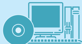
ID Maker 2009